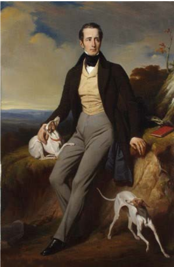
Alphonse de Lamartine - portrait par Henri Decaisne - musée de Mâcon (71) France